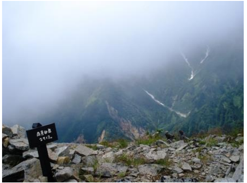
(南真砂岳は生憎の展望)