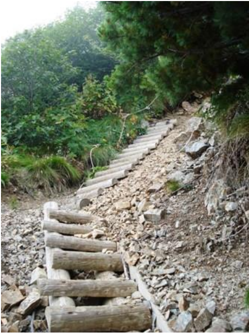
(急斜面のガシタ登山道)