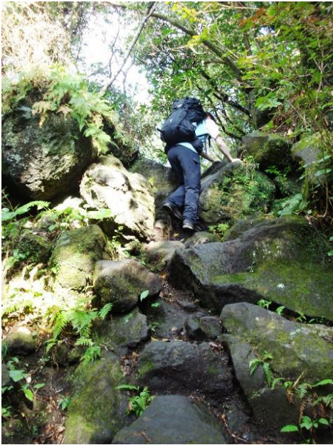
(7 合目から 8 合目までの途中)

8 合目に向け、大きな岩場をよじ登る、ちょっとしたロープ場が出て来る。軍手があるといいかもしれない。