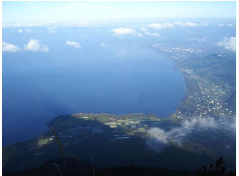
(9 合目途中からの景色、影は開聞岳)