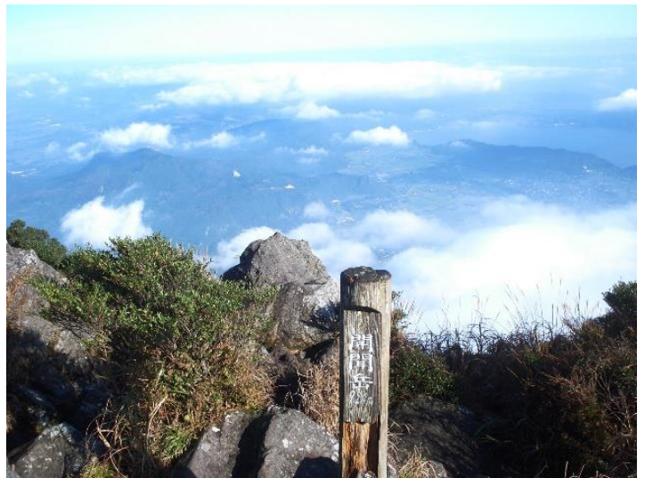
(↑山頂から薩摩半島方面)