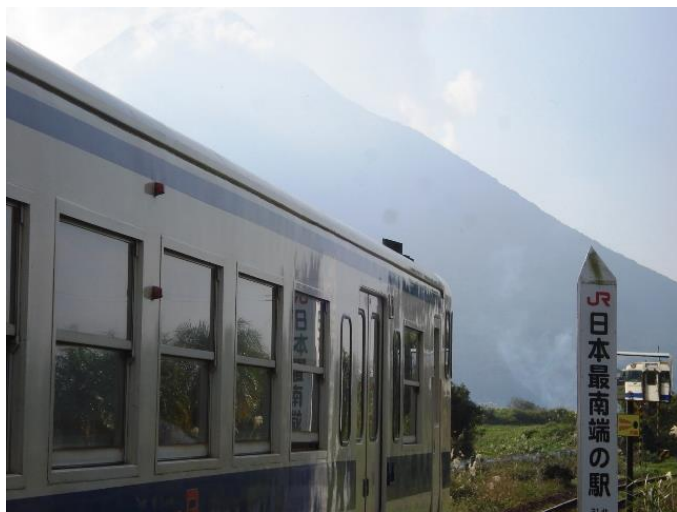
(日本最南端のJR駅 西大山駅と開聞岳)