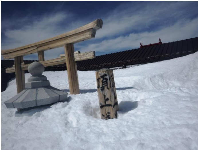
(山頂は思ったよりまだまだ雪が残っています)