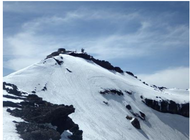
(剣ヶ峰にはたくさんの人影が)