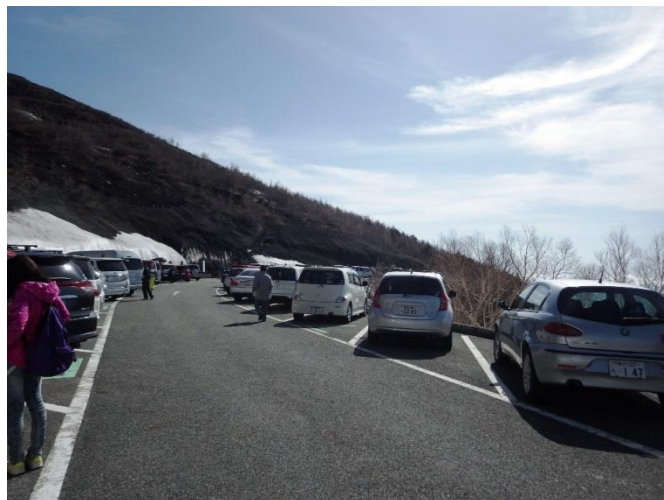
(5合目駐車場、景色堪能できます)