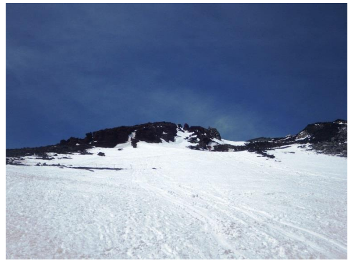
(9合目小屋より、近くて遠い山頂です)