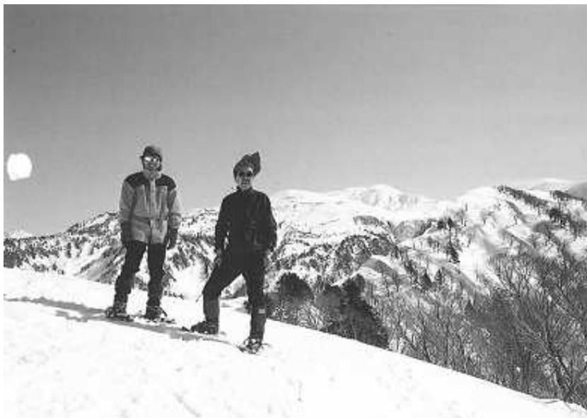
2001年2月八幡平茶臼岳