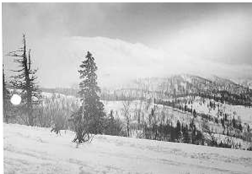
2000年4月 定山溪温泉 無意根山