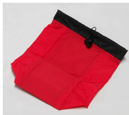
アイゼンケース赤色系