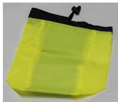
アイゼンケース黄色系