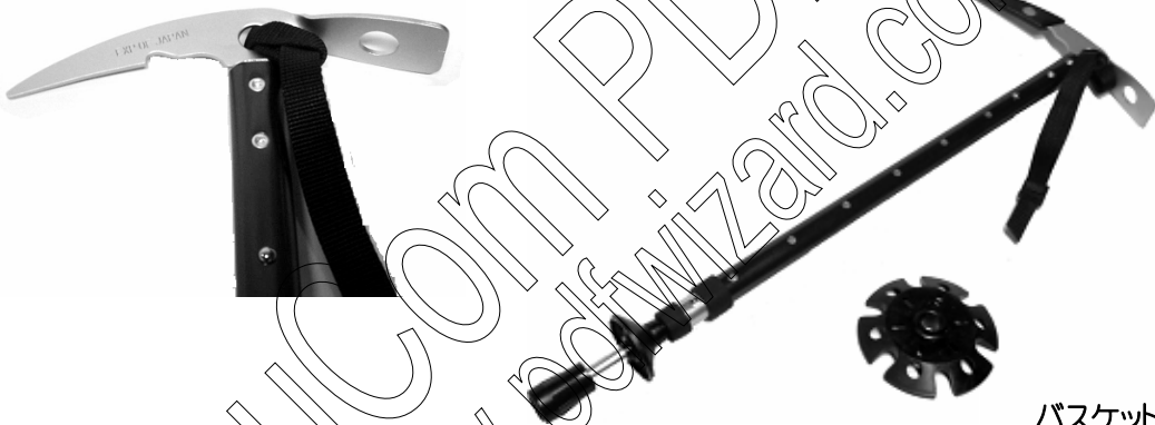
バスケット大 税込価格¥1,155